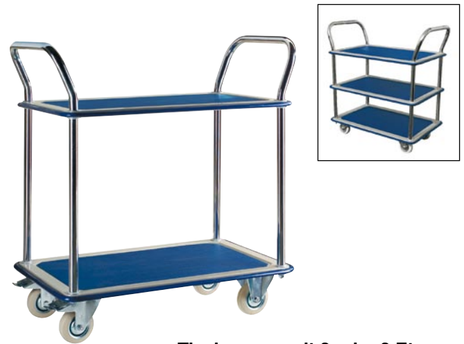
Tischwagen mit 2 oder 3 Etagen

Verchromter Stahl-Schiebegriff mit lackierter Plattform. Ladeflächen mit rutschhemmendem Kunststoffbelag; rundum Kantenschutz. Tragkraft 120 kg. Ladehöhe 140 / 655 mm bzw. 140 / 398 / 655 mm. Gesamtmaß LxBxH 810x490x860 mm. 2 Bock-, 2 Lenkrollen mit Radfeststeller. Rad-Ø 100 mm. Lieferung demontiert, leichte Montage.