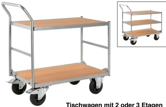
Tischwagen mit 2 oder 3 Etagen